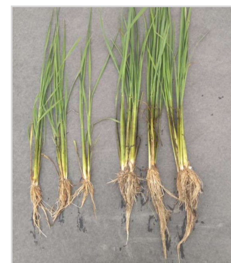
↓ Testigo ↓ BioPlusIII